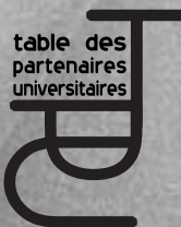
table des partenaires universitaires

la Table des syndicats universitaires (TSU-CSQ)